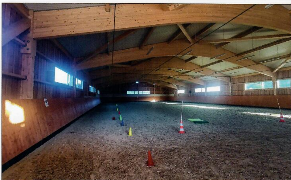
150 Kinder kommen jede Woche ins Regenbogental nach Leobersdorf – dafür steht jetzt auch die 1.000m 2 große Therapiehalle zur Verfügung.

Das Dankesschild an der neuen Therapiehalle listet alle Unterstützer auf.